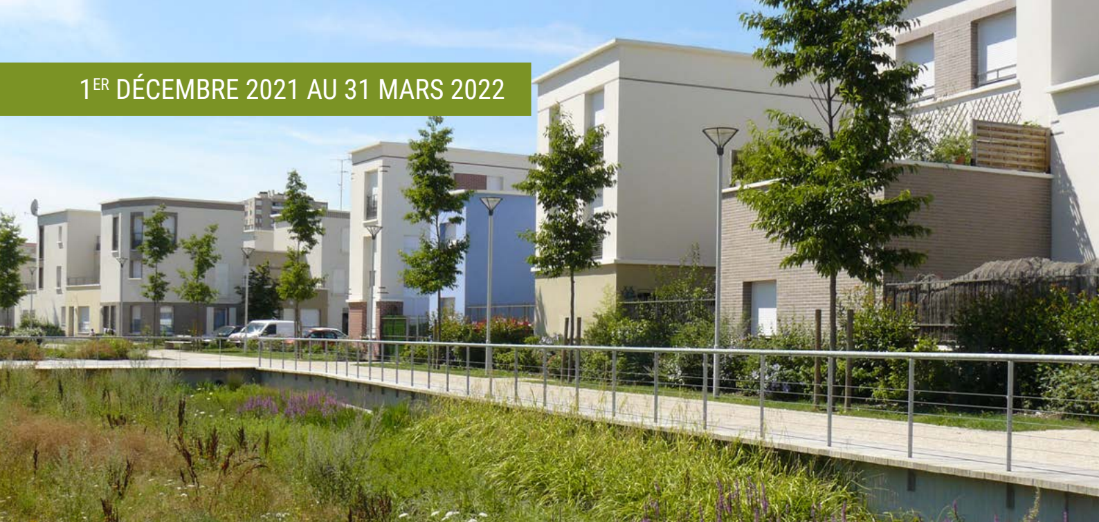
Quartier des 3 rivières à Stains - Noues avec passerelle