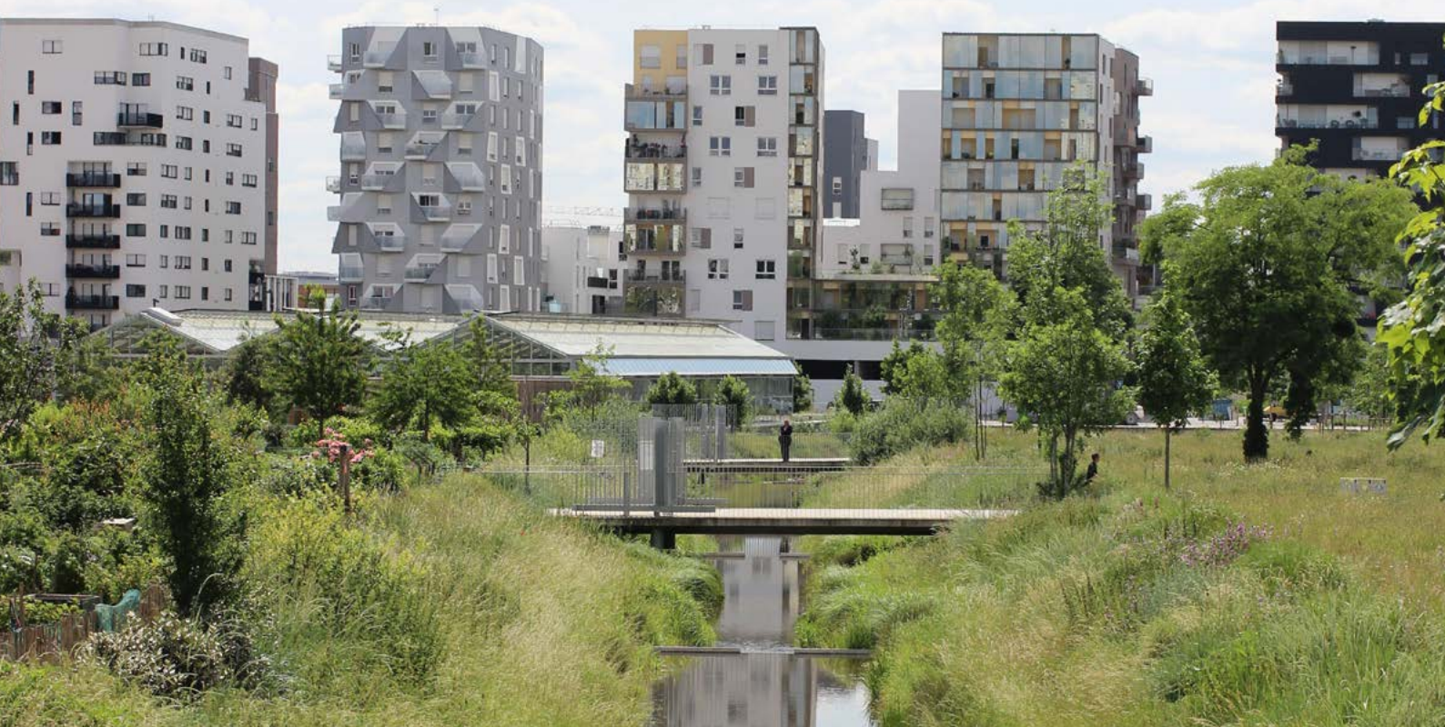
Parc de la Zac des Docks, Saint-Ouen