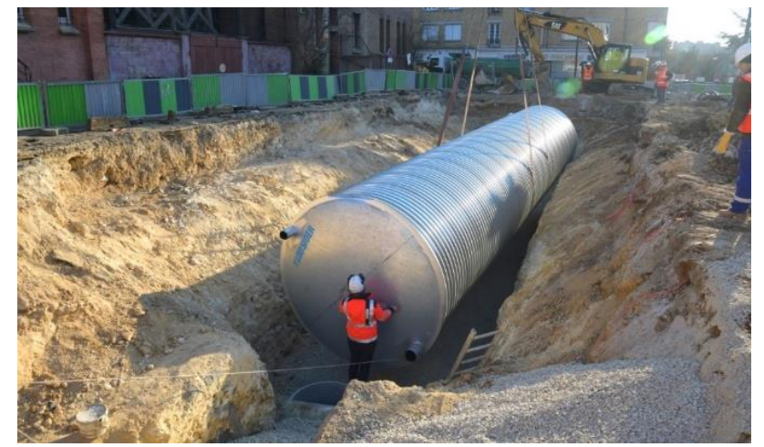
Cuve de récupération des eaux de pluie d'une toiture (Suresnes)