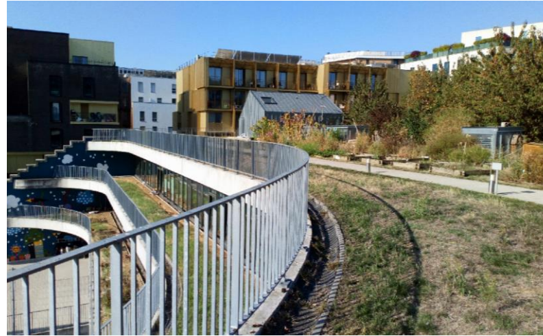
Ecole de la biodiversité, Boulogne-Billancourt, Source : AESN