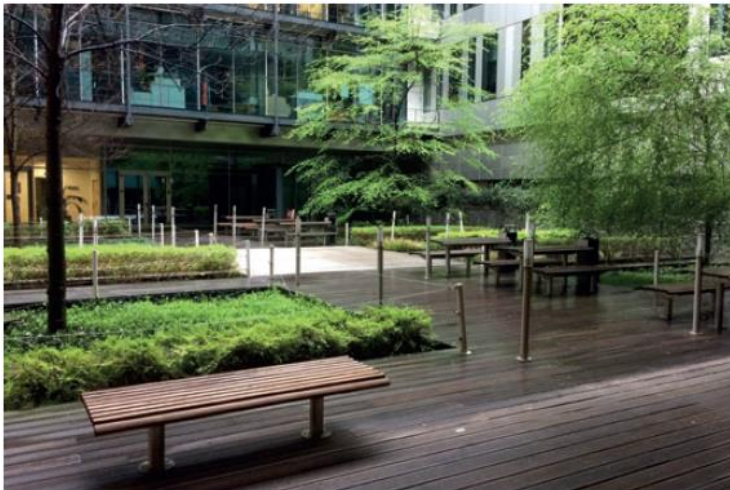
Espaces végétalisés dans un atrium (Paris 13 e)