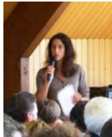
Restitution des travaux des commissions thématiques par les bureaux d'études